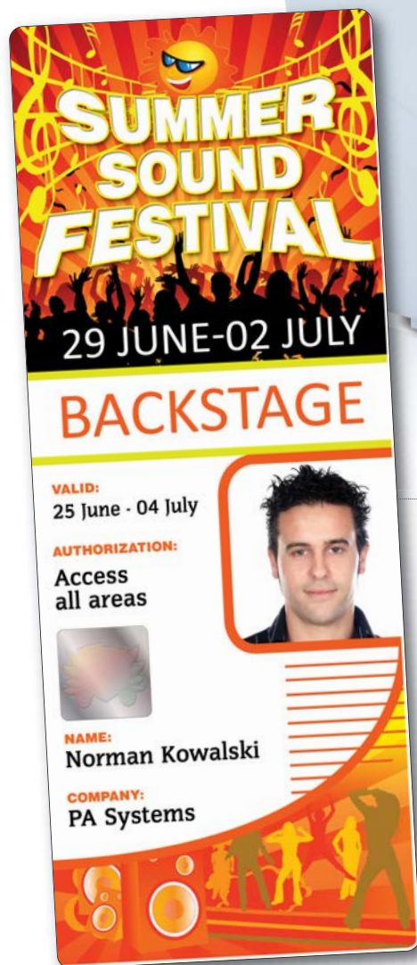
TARJETA CR80 ESTÁNDAR